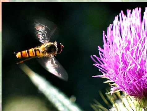
Schwebfliege ( Episyrphus balteatus )

Schwebfliegen Die erwachsenen Schwebfliegen sind sehr gute Bestäuber und jede Schwebfliegenlarve frisst eine große Anzahl von Pflanzenschädlingen, wie z.B. Blattläuse. Diese doppelte Funktion der Schwebfliegen macht sie besonders relevant für das Ökosystem.