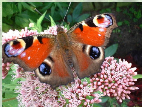
Tagpfauenauge ( Aglais io )